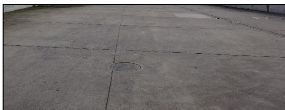
Abb. 5: Mit Betonplatten versiegelte Fläche innerhalb des Plangebiets