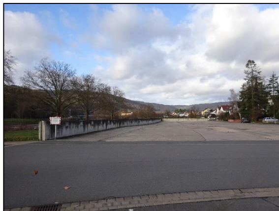
Abb. 4: Blick von Süden auf das Plangebiet