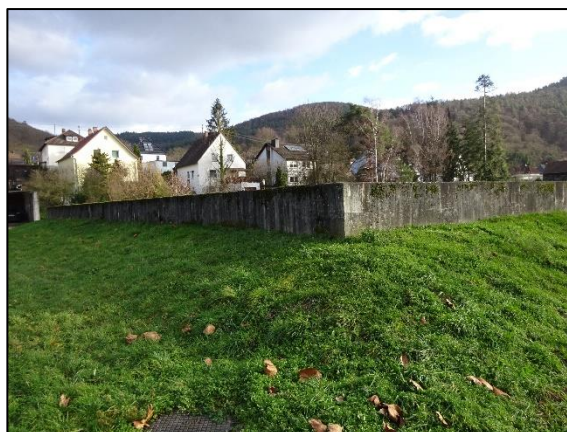
Abb. 6: Einfriedung des Plangebiets im Nordwesten