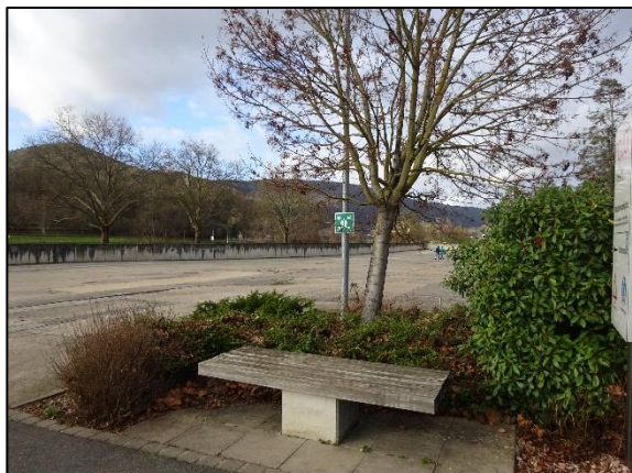
Abb. 3: Parkbank mit Gehölzen im Südosten des Plangebiets.