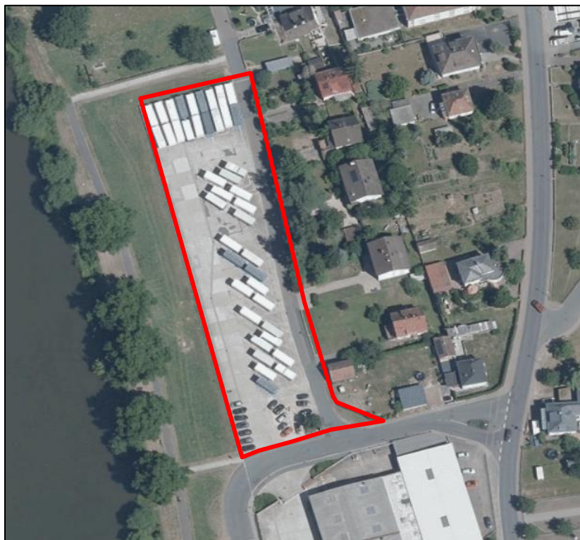
Abb. 1: Lage des Plangebietes (rot umrandet).