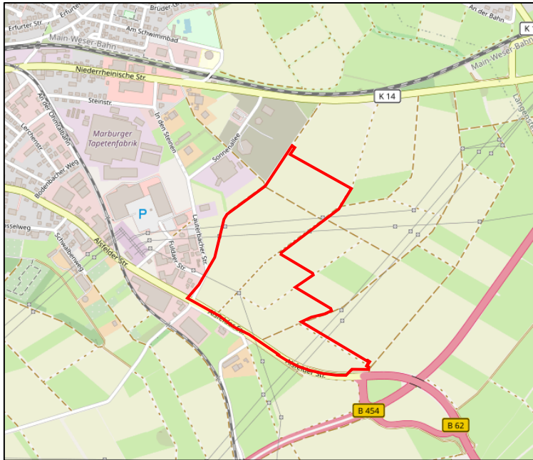
Abbildung 2: Räumliche Verortung des Plangebietes