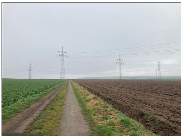
Abb. 6: Blickrichtung Norden