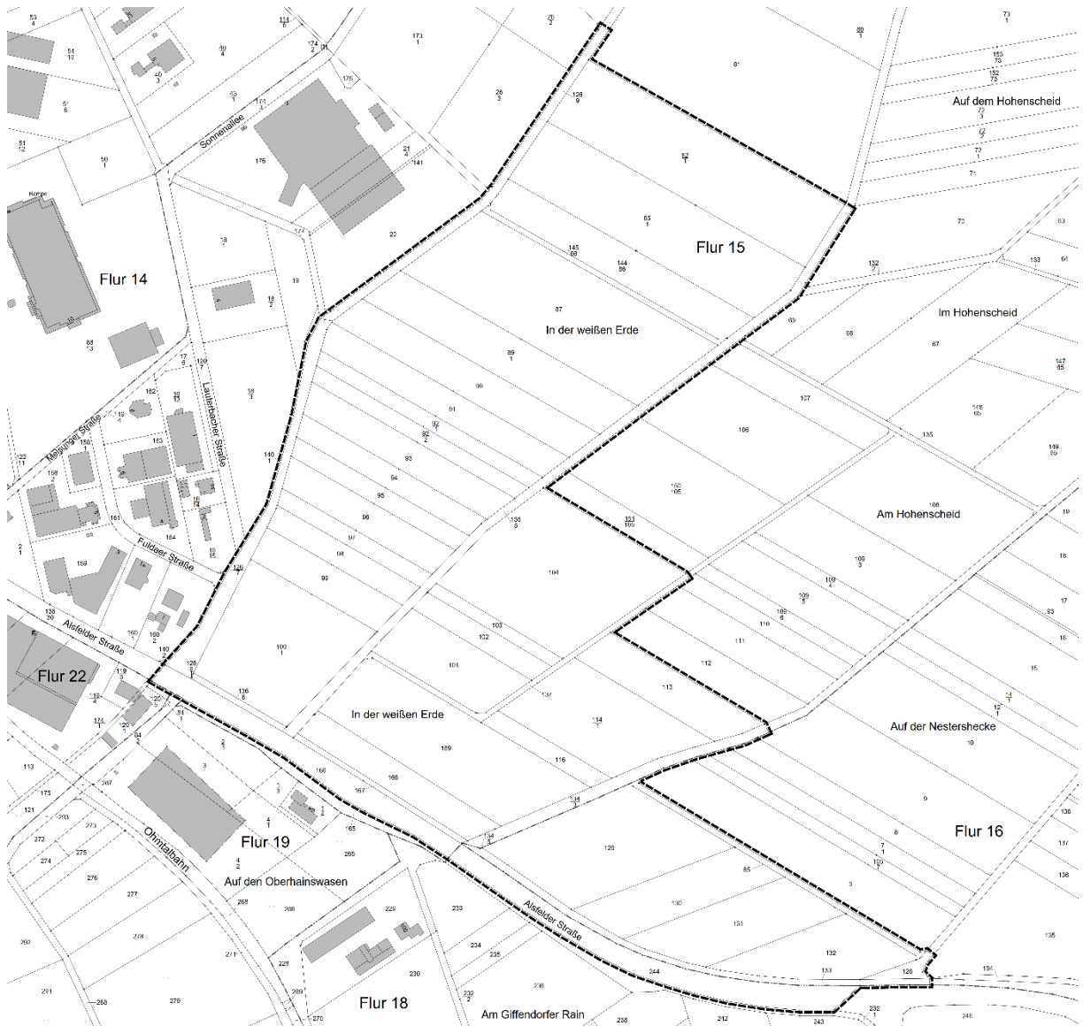
Abbildung 1: Räumlicher Geltungsbereich der FNP-Änderung im Bereich BP „Rußweg II“