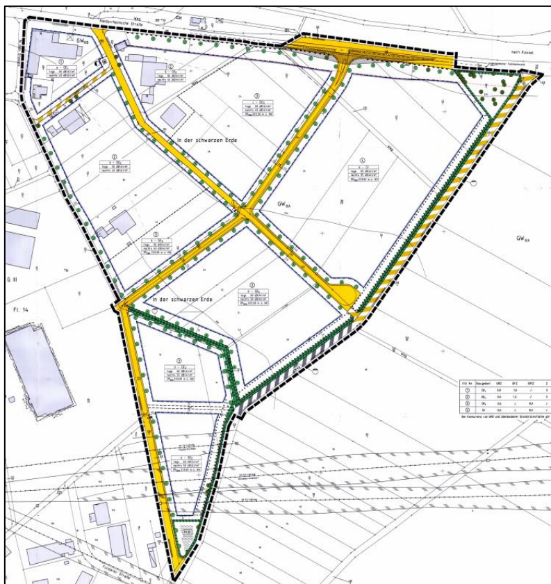
Abb. 7: Ausschnitt aus dem rechtskräftigen Bebauungsplan „Gewerbegebiet Ost“ (2005)

Die Kennwerte für die entsprechenden Gebiete wurde mit einer Grundflächenzahl ( GRZ ) von 0,8 (GE 1 ) bzw. 0,6 (GE 2 , GE 3 & GI), einer Geschossflächenzahl ( GFZ ) von 1,6 (GE 1 ) bzw. 1,2 (GE 2 ) sowie einer Baumassenzahl ( BMZ ) von 8,0 (GE 3 & GI). Die Zahl der maximal zulässigen Vollgeschosse wurde auf Z=II sowie die maximale Oberkante über Normal Null (OK N.N. ) 220 bzw. 225 bzw. 222,5 Meter. Die Darstellung der überbaubaren Flächen und Baugrenzen erfolgt großzügig, aber mit einem Mindestabstand zu den Erschließungsstraßen. Die Festsetzungen über das Maß der baulichen Nutzung wurden so gewählt, das der Topographie und der Lage zur Kernsdat ausreichend Rechnung getragen wird, um eine mit dem Landschaft- und Ortssbild verträgliche Höhenstaffelung zu entwickeln.