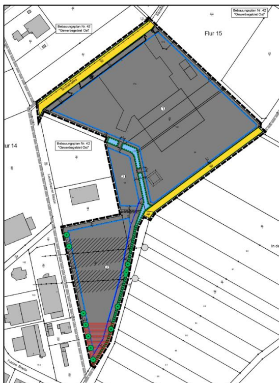
Abb. 9: Geltungsbereich der 4. Änderung des Bebauungsplanes „Gewerbegebiet Ost“ (2023)

Teile des Geltungsbereiches des Bebauungsplanes „Gewerbegebiet Ost“ werden durch die vorliegende Planung tangiert: Die östliche Verkehrsfläche (siehe Abb. 9) wird im vorliegenden Bebauungsplan durch die Vergabe von Geh-, Fahr- und Leitrechten aufgrund des Vorhandenseins unterirdischer Gas- und Infrastrukturleitungen sowie geplanter Leitungsachsen überlagert. Diese werden festgesetzt, um die geplante Leitungsinfrastruktur, die mit der Ausweisung des Gewerbegebietes einhergeht, in Richtung Alsfelder Straße zu sichern und anzubinden.