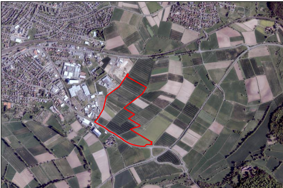
Abb. 3: Lage des Plangebietes (Luftbild)