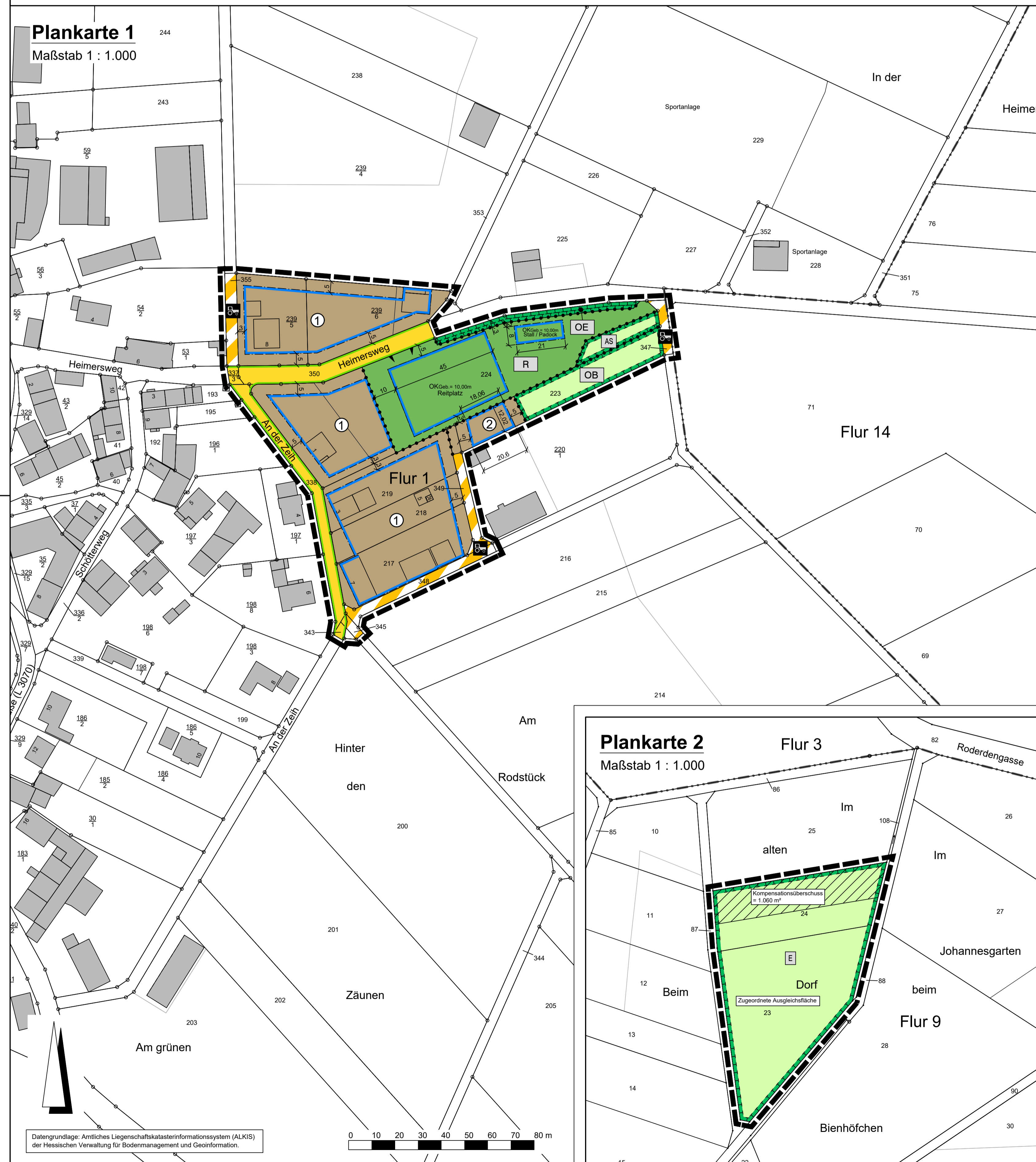
Plankarte 2 Maßstab 1 : 1.000